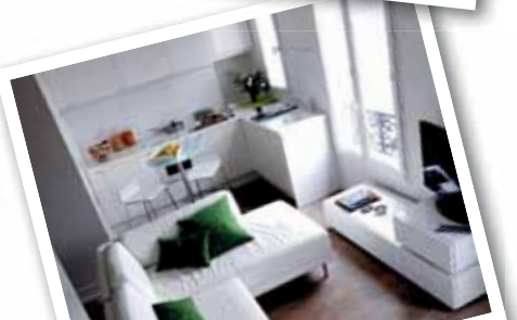
MOGELIJKE INDELING WOONKAMER