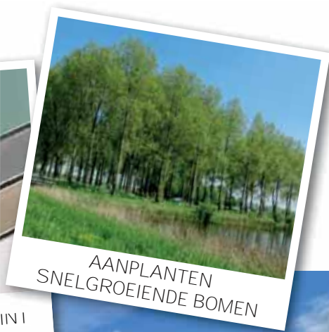
AANPLANTEN SNELGROEIENDE BOMEN