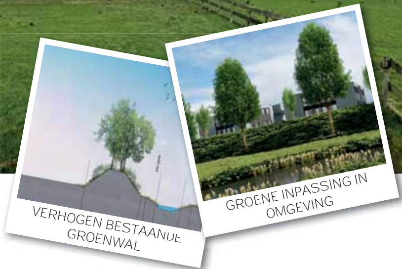
VERHOGEN BESTAANDE GROENWAL GROENE INPASSING IN OMGEVING