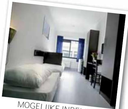
MOGELIJKE INDELING SLAAPKAMERS